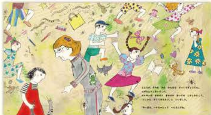
ハナの大切な生き物を見たみんなはびっくりぎょうてん！大騒ぎになります。