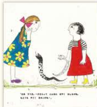
みんなが「気持ち悪い」と逃げますが、ハルが声をかけてくれました。