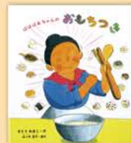
「はばあちゃんのおもちつき」