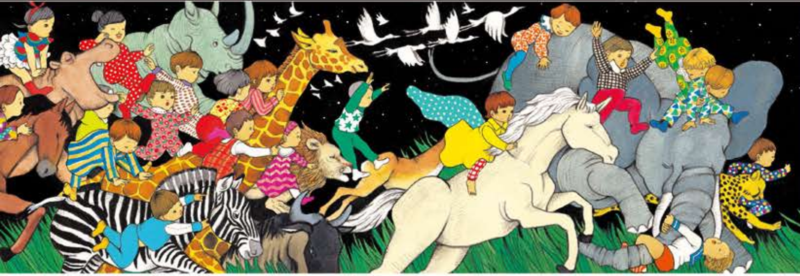
さうげんを ほしる どうぶつたちも