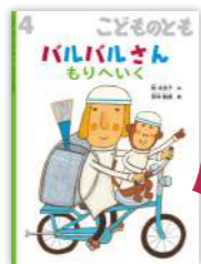
こどものとも2025年4月号 『バルバルさん もりへいく』