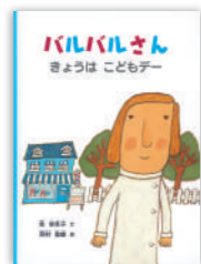
『バルバルさん きょうは こどもデー』